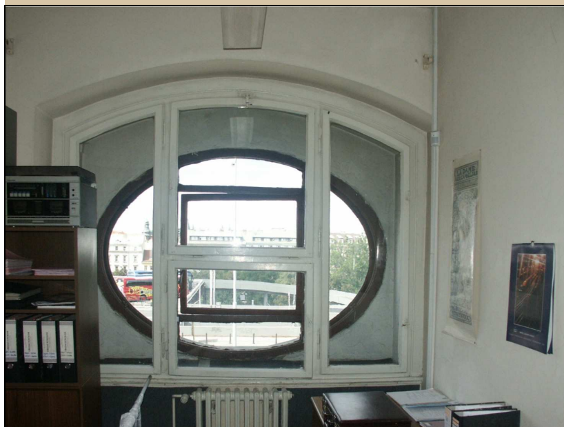
celkový pohled z interiéru